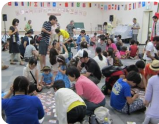
こどもけんりカルタ大会