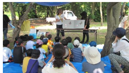
木陰で紙芝居を楽しむ子どもたち