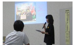
TSUTAYA タmamラブックセンターさん