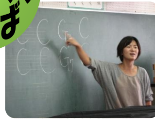
中央小のウクレレクラブの練習風景