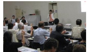
群馬ヤクルト販売さん