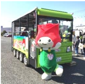
たまたと電動バス