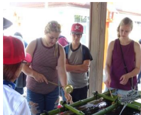
エレンズバーグの学生たちをガイド

ガイドたまむらの会では、勉強会を重ねて見識を深めています。また、町内外からのガイド依頼に応じて町内を案内し、玉村町を訪れた多くの方々に喜ばれています。