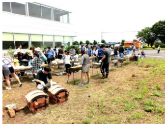
今春の農業祭の様子

(株)ケアコム工場での秋の収穫祭が行われます。みんなで春に植え付けたサツマイモを掘って味わいます。ぱるではウクレレ、フラダンス、電動バスなどで収穫祭を盛り上げます。ぜひ、ご参加を!