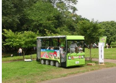
こどもの森まつりで水辺の森を走る