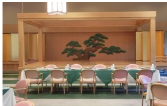
緑野カントリークラブの能舞台