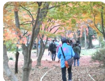
紅葉の中をウォーキング