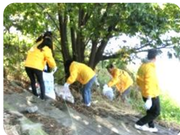
ゴミや枯れ枝を拾い、きれいに！

地域社会貢献活動をしている桐生信用金庫（玉村支店他）と岩倉自然公園水辺の森を愛する会による合同環境整備活動が行われます。一般の方の参加も大歓迎です。