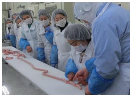
ウィンナー作り体験

昨年に引き続き、11月29日「いい肉の日」に合わせて全国食肉学校での施設見学とウィンナー作り体験会を開催します。普段見られない学校の見学やウィンナー作りを通して肉についての理解を深めることができ、手作りしたウィンナーも試食することができます。ぜひ、ご参加ください。