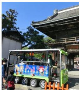
電動バスも走るよ

楽しさいっぱい! *たまたんマルシェ* ◆クラフト販売 ◆キッチンカー ◆お笑い&アイドルライブ ◆開運餅まき（当たり付き） たまたんも来るよ!