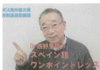
ぱるチャンネル「スペイン語ワンポイントレッスン」