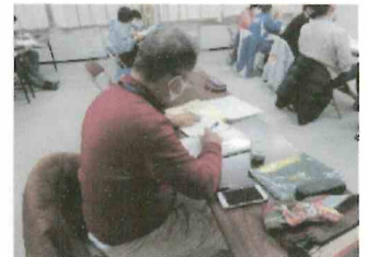
学習塾 HOPE 学習支援