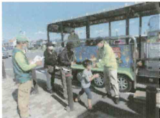
電動バスドライバーズクラブ 「ゆるたま号」運行