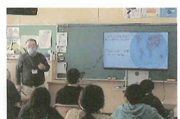
上陽小学校特別授業