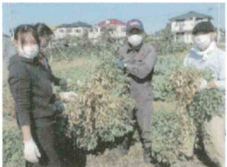
たまむら食の探検隊 落花生の収穫体験