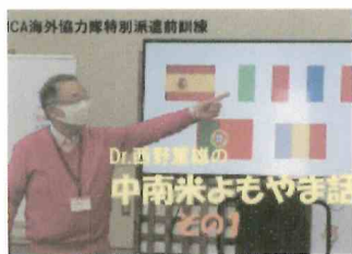
ぱるチャンネル 「中南米よもやま話」