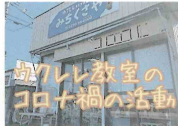
みちくさやリモートレッスン