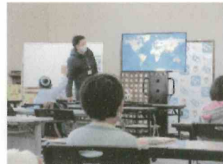
JOY クラブ ジョイキッズ特別授業