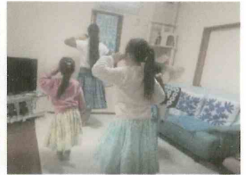
フラをおうちでレッスン