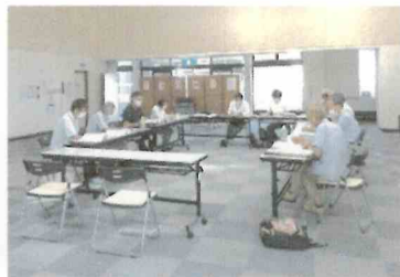
広いスペースで間隔を開けて