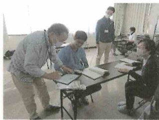
玉村町国際交流協会 日本語教室