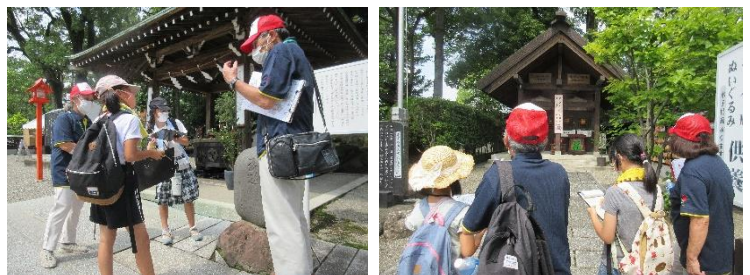
玉村八幡宮の境内のなぞを解く子どもたち

まちの案内人 ガイドたまむらの会 メール: gaidotamamura@gmail.com