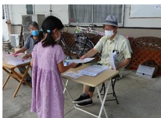
宿題を受け取る子ども

玉村町囲碁会は、毎週土曜日勤労者センターで「子ども囲碁教室」を開いています。しかし、新型コロナウイルス感染症が拡大してからは、感染防止のため対面を避け、プリントの宿題方式を取っています。