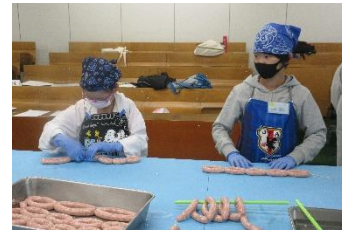
ウィンナーづくり

子どもたちは、牛や豚、鶏の命をいただくことの意味と食の大切さを学んで帰りました。