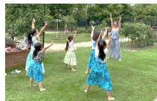
イベント出演と子どもフラ体験