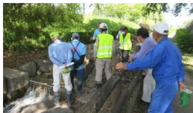
除去作業する会員

空き缶やペットボトル、ビニール製品などのゴミが多く、会では「安易にゴミのポイ捨てなどは絶対やめてほしい！」と呼びかけています。