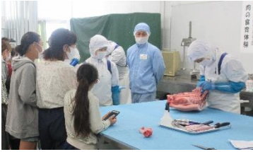
肉の加工の様子を見学