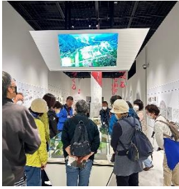
やんば天明泥流 ミュージアム