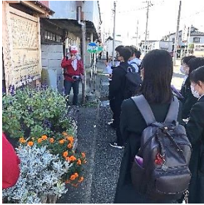
説明に聞き入る玉村高校生

群馬県立玉村高校では、1年生を対象に「玉村町探究の時間」という玉村町のことを知る授業を設けています。今回、10月11日（水）・12日（木）の2日間にわたり、「ガイドたまむらの会」のガイドによる「まちめぐり」を実施しました。