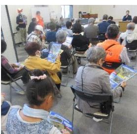
防災マップの解説

玉村町では、住民団体の主催する防災イベントとして初開催であり、来場者も説明を興味深く聞いていました。今後、防災意識が高まり災害に強い町づくりにつながることを期待されます。