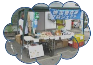
「おかげさん」の会による 気仙沼特産品販売