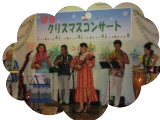
サウスウィンズのみなさん

ぱる主催のクリスマスコンサートを開催しました。ご参加、ご出演していただいた皆様ありがとうございました。