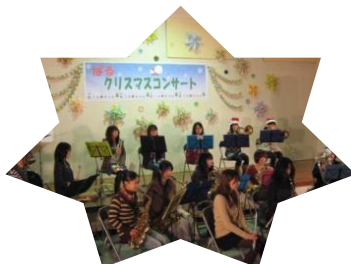
県立女子大学 吹奏楽部のみなさん

色鮮やかなクリスマスリースを始めとするネイチャークラフト展も同時開催し、会場内を華やかに彩りました。